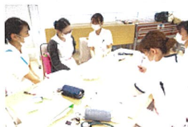
フィジカルアセスメント