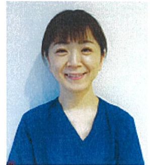
手術看護認定看護師

手術看護が好きで、全身麻酔下で訴えることのできない患者さんに、代弁者としてよりよい看護を提供するために専門的な知識を身につけたいと思いました。また、これからの手術室の人材育成のために、必要な知識を得て指導力を向上させたいと考え、手術看護認定看護師を目指しました。