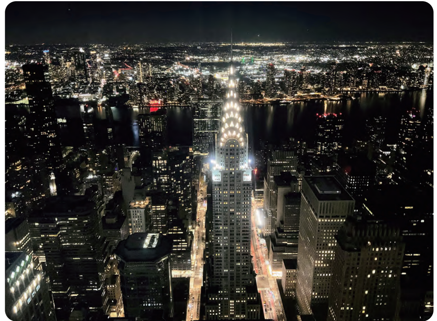
マンハッタンの夜景 (SUMMIT One Vanderbilt)